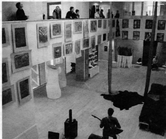
Lungo il percorso si ascolta musica suonata dagli studenti